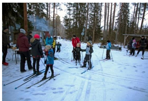
Barnens Vasalopp 2023-03-16

Varmt och slutåkt för säsongen trodde vi alla den 18/3 men i slutet av månaden kom rikligt med snö och därefter åter fina skidspår och bra skidåkning till den 5/4 då skidsäsongen definitivt tog slut.