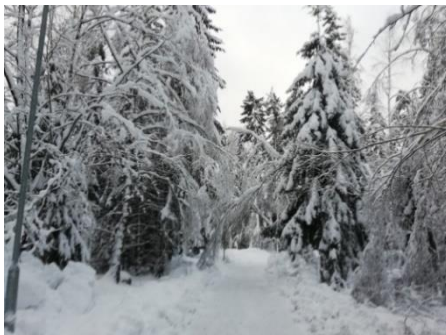
Vinterbild från december 2023

Fortsatt bra förutsättningar för skidåkning och skidspåren förlängdes med 3 km ute på fältet, Hannebergsrundan. Även ängen mot Erikslund spårades och därmed var längden på de preparerade skidspåren ca 7,5 km. Resten av året blev en riktig skidfest med mycket snö och mycket folk i spåren. För att ytterligare förbättra spåren så kunde sektionen låna en snövessla som packade och drog fina spår på fältet.