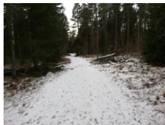
Reparation efter kabelbrott genomförd 2023-02-13

Strax före jul föll mycket tung snö som medförde återigen att träd knäcktes och ramlade över spåret dock inte så att elkabeln skadades. Mycket jobb krävdes av sektionen för att ta bort de nedfallna träden och resten av året blev en riktig skidfest med mycket snö och mycket folk i spåren.